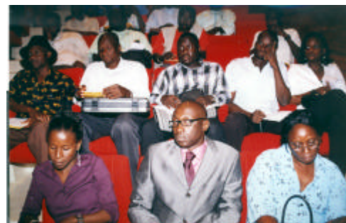
Vue partielle des séminaristes à la cérémonie de clôture.