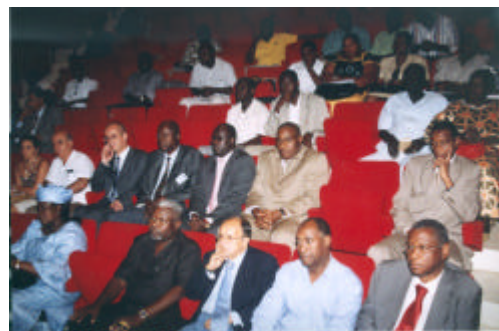
Vue partielle de la cérémonie de clôture, au premier rang : les membres du Gouvernement et du Corps diplomatique.