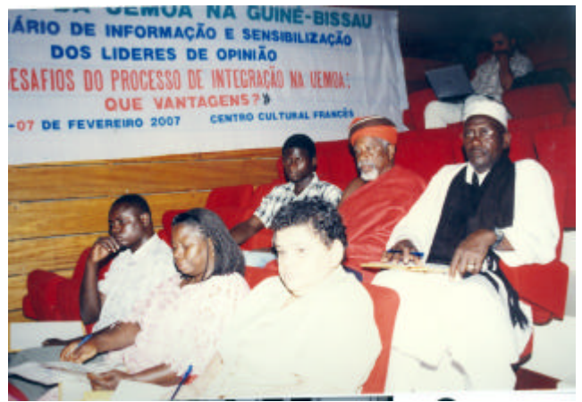
Autorités traditionnelles au cours des travaux

C'est donc sur une note générale de satisfaction et une demande d'une plus grande information sur les chantiers de l'UEMOA en Guinée-Bissau que se sont achevés les travaux. Il a été recommandé particulièrement à tous les groupes socioprofessionnels, aux journalistes et aux populations de Guinée-Bissau, l'utilisation exhaustive des services du Bureau de la Représentation de la Commission en Guinée-Bissau, des Ministères des Finances, à travers le