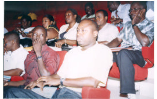
Vue partielle des séminaristes

Comité National de Politique Economique (CNPE), et de l'Economie à travers la Direction Générale de l'Intégration Régionale (DGIR), comme sources d'information sur les activités de l'UEMOA.