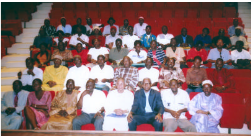
Participants et animateurs au séminaire des communicateurs en langues nationales

Plusieurs membres du Gouvernement, du Corps Diplomatique et des Organisations Nationales et Internationales avaient également pris part à la cérémonie d'ouverture de cette "Semaine".